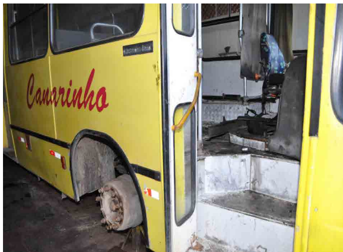
Antes da intervenção apenas 8 ônibus estavam em funcionamento.

Só no ano passado a Agência Municipal de Trânsito e Transporte (Agetrat) emitiu mais de 450 notificações a empresa de ônibus. “Nesses seis meses de intervenção queremos alcançar aquilo que não conseguimos em um ano: ter informações detalhadas da empresa, saber qual a situação dela de verdade, qual a receita, a despesa e tudo o que precisa ser feito para que façamos uma nova concessão. Esse é nosso objetivo”, explicou o prefeito no dia da intervenção.